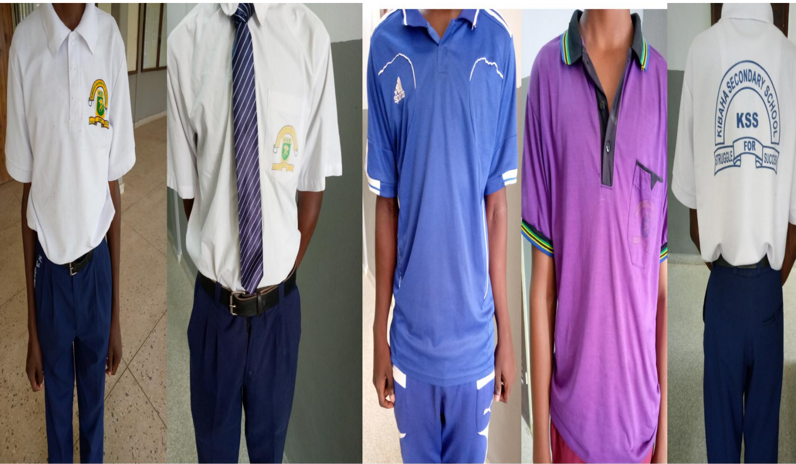
VAZI MBADALA LA DARASANI