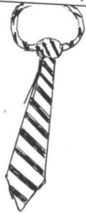
NECK TIE (TAI)