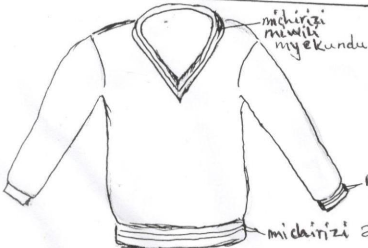
SWEATER (Grey) KIJIVU