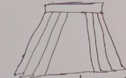
Sketi ya darasani (Blue bahari)