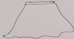
Sketi ya michezo (Njano)